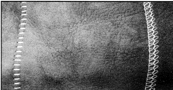
Nahtbild Seam appearance Aspect de la couture Aspecto de costura

Esta máquina de sobrehiilar un hilo tiene una gran variedad de usos: Para pieles, piel de terciopelo, cueros, cueros aterciopelados, combinaciones de pieles con materiales sintéticos y discos sintéticos para dar brillo. Por la razón de que la máquina realiza una puntada sobrehilada muy linda, también se puede utilizar para puntadas de decoración y para unir las partes laterales y traseras. Para conseguir diferentes efectos, la costura se puede realizar por la derecha o por la izquierda que igualmente el tipo de la puntada por ambos lados va a ser muy bonita. Opción: platos de transporte y auxiliares fácilmente intercambiables según los diferentes tamaños y versiones. También un cortahilos, otro brazo, y una mesa de apoyo para piezas de gran tamaño.